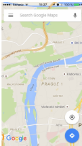
Figure 1.1 Lorem ipsum dolor sit amet, consectetur adipiscing elit. Curabitur massa turpis, semper quis fringilla ut, viverra nec risus. Pellentesque habitant morbi tristique senectus et netus et malesuada fames ac turpis egestas. Donec nunc lorem, sollicitudin vel sedales eget, vehicula nec mi. Proin ullamcorper rutrum nisl, at porttitor nunc euismod et. Donec faucibus nisi faucibus ipsum porttitor pharetra. Sed elementum, lectus nec congue imperdiet, ipsum leo viverra nisi, sit amet conammodo odio odio si nisl. Fusce sagittis lobortis nisi sed consectetur.

Je-li obrázek spíše vysoký než široký, může se hodit umístit popisek k němu vedle obrázku a ne pod ním nebo nad ním. To lze provést třeba takto