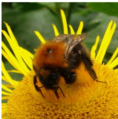
Obrázek 2.1. Ukázka vložení obrázku na střed, což je asi nejobvyklejší.

Makro \cinspic vyžaduje jméno souboru s příponou ukončené mezerou podobně jako příkaz \input .